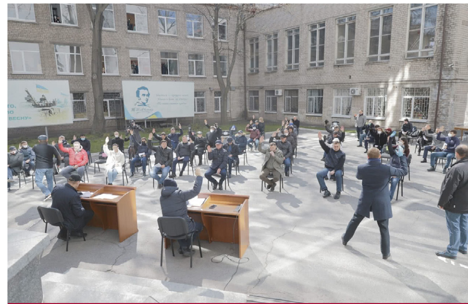
Дніпровська міська рада засідає у дворі через епідемію.

Проте є важливим перший досвід Дніпровської міської ради, яка 25 березня 2020 року спочатку провела звичайне засідання, де затвердила порядок денний і прийняла рішення №2/55 від 25 березня 2020 року «Про внесення змін до Регламенту Дніпровської міської ради VII скликання». Цим рішенням було передбачено проведення дистанційних засідань. Вказане рішення доступне на сайті міської ради. Потім міська рада після перерви провела дистанційне засідання в режимі відеоконференції. Відеозапис на YouTube доступний за посиланням https://youtu.be/u2xP6LHilLw .